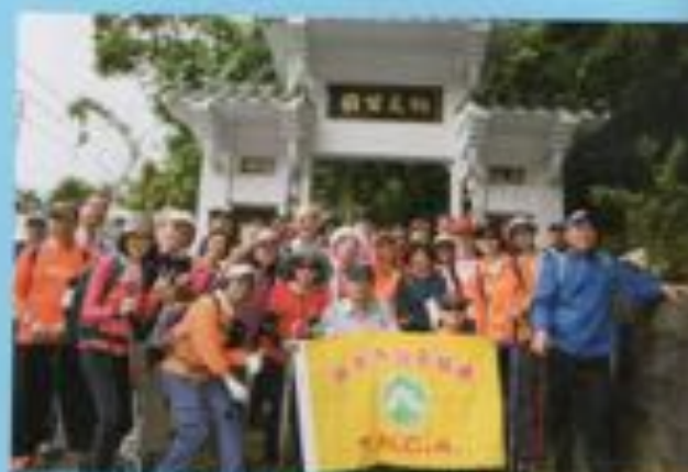
▲新北市土城火炭山天上山