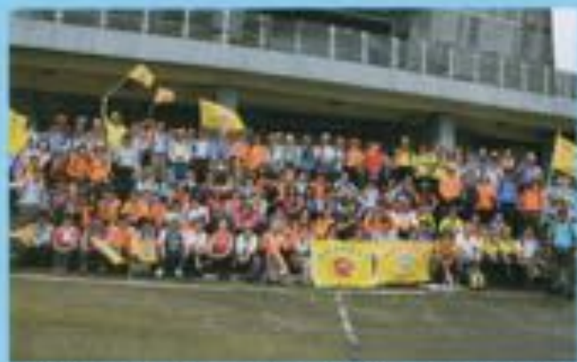
▲與航岳姐妹會會師於基隆海科館