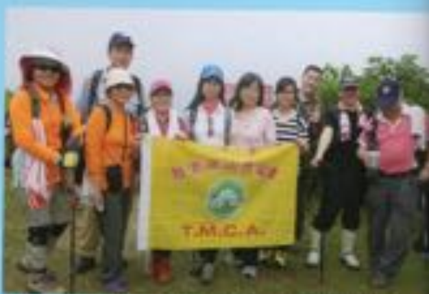
▲基隆市龍崗步道橫子寮炮臺