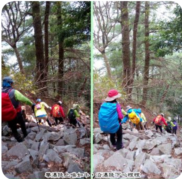
攀瀑陡上喘如牛，沿瀑陡下心慌慌

秋意猶在冬悄然，山櫻搶春上枝頭 蒼松矗立添古意，人在幽徑不知春 去冬千穗遇馬蘭，再見馬蘭坡津加 小白花影鬼督郵，去春立霧初相逢 小段陡下後陡上，斷崖峭壁五葉松 踩石躍階跳格步，樹影婆娑自起舞 橫渡石瀑再陡上，大甲溪南攬山巒 緩稜幽徑添詩意，猶見岸然二葉松 遠眺山巒心飄然，悠遊群山入夢來 樹影搖曳舞春風，枝桠新芽染春色 遠山浮雲悠遊夢，不見昨日與明日 傲立山坡影自在，青山白雲意悠悠 佇立石上群峰現，欲走還留頻回首 青山依舊色不改，林徑依然影自在 攀瀑陡上喘如牛，沿瀑陡下心慌慌 步步為營步步輕，也無風雨也無晴