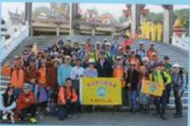
▲新北市淡水天元宮山仔頂步道