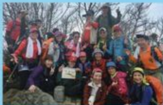
▲苗栗縣山-加里山