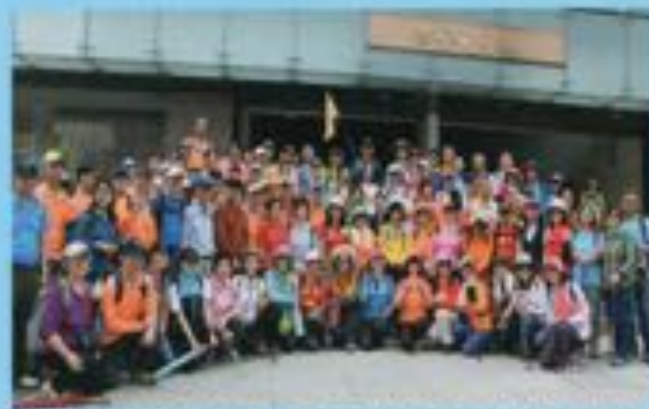
▲台北市內湖小金面山剪刀石山文閣山