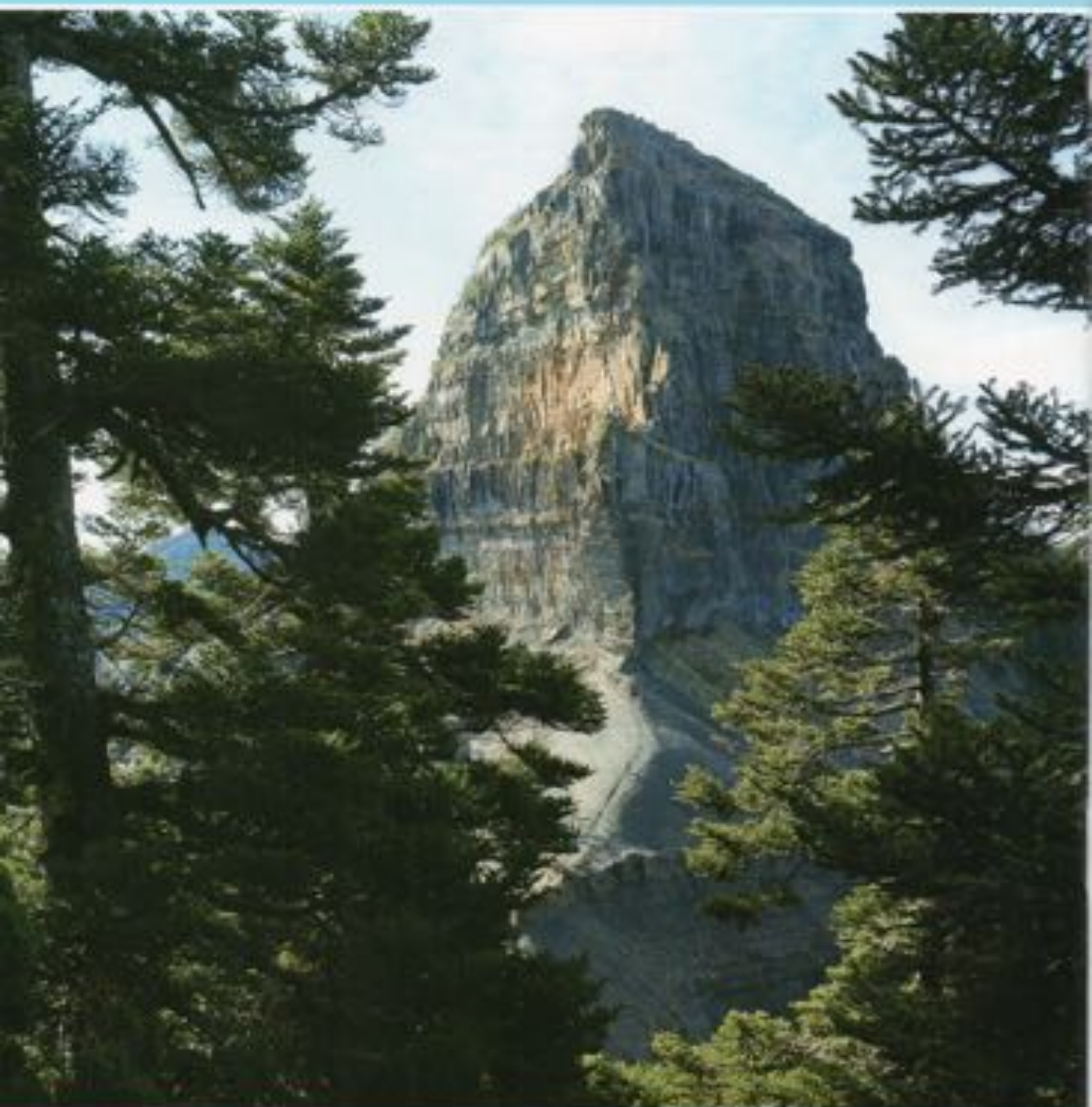
世紀奇峰-大霸尖山