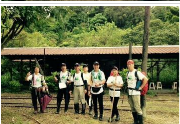
礦業博物館運煤小火車站站前合照