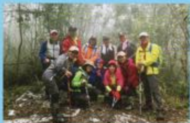
▲宜蘭南澳御恩山