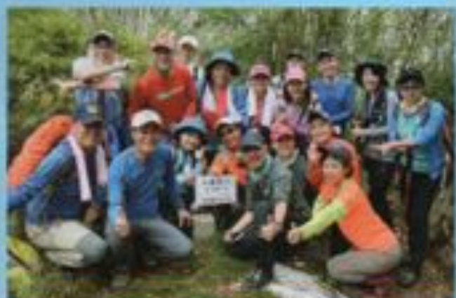
▲新竹尖石石麻達山