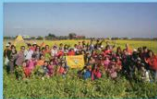
▲嘉義頂石棹步道群九層龍坪山

會址: 台北市承德路二段一巷七號四樓 網址: http://www.tmca-tpe.org/