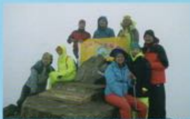
▲理事長登頂玉山主峰與隊員合照