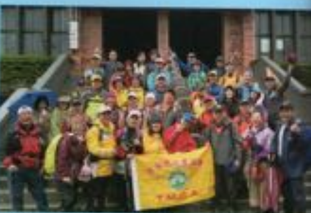
▲新北市瑞芳龍山古道越嶺金瓜石黃金博物館