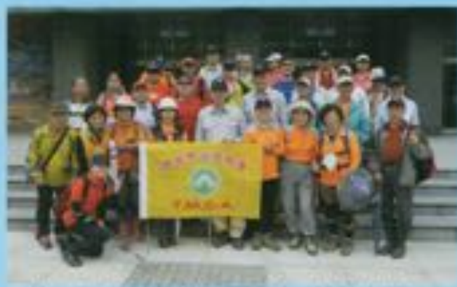
▲台北市士林九蓮寺遠走忠勇山