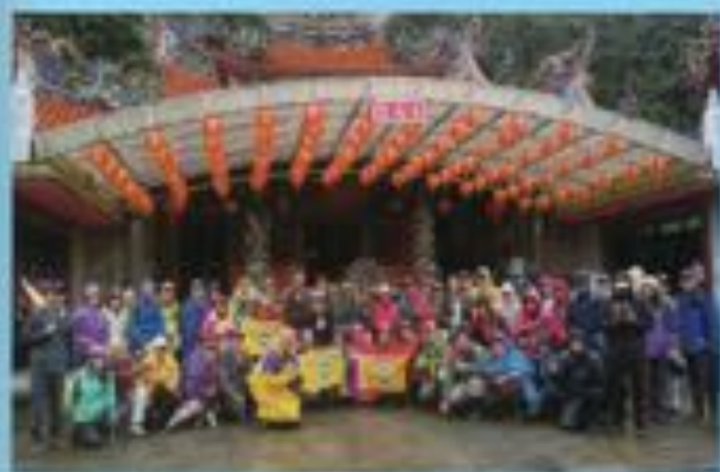
▲新竹關西赤柯山東御頭山