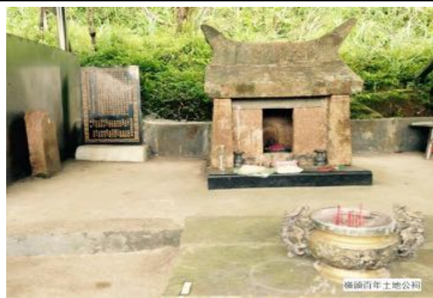
礦師百年土地公祠