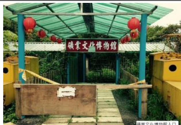
礦業文化博物館入口