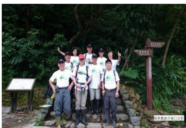
高東高研步道入口合照