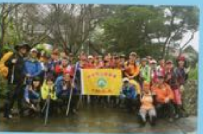
▲台北市北投清天宮越嶺向天地下天元宮