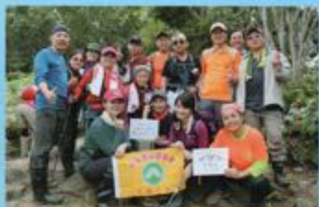
▲苗栗水雲三星餅行老二之上高山