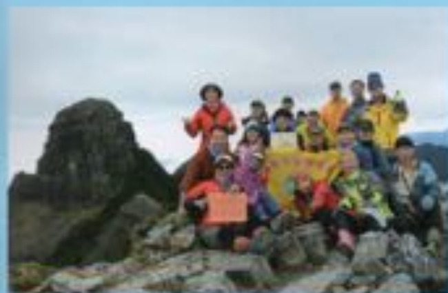
▲小霸尖山登頂合照，背景為大霸尖山