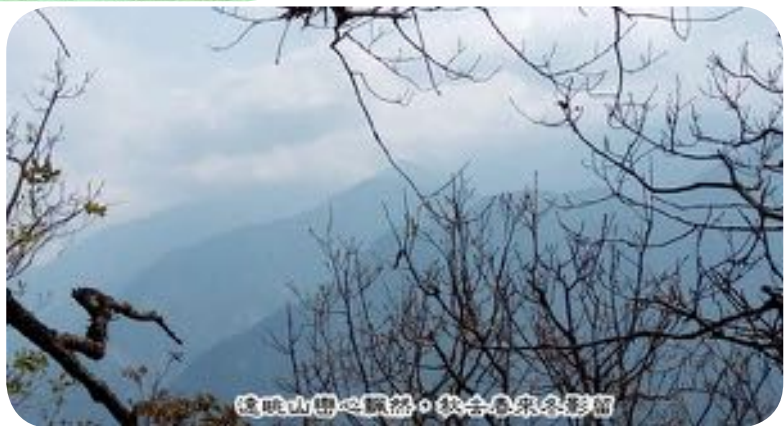
遠眺山巒心飄然，秋去冬來冬影前