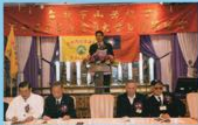
▲本會第十屆第三次會員大會